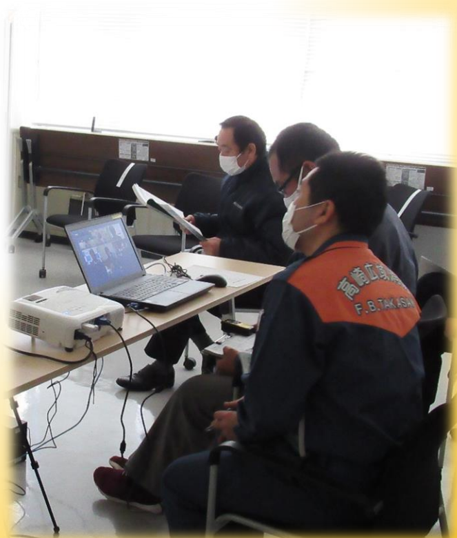
会議室でWEB発表の視聴中