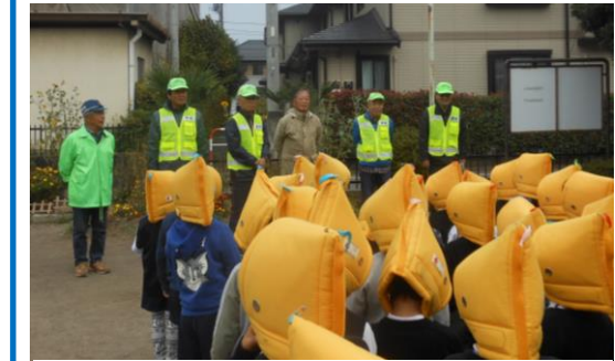
三角公園への二次避難・引き渡し訓練