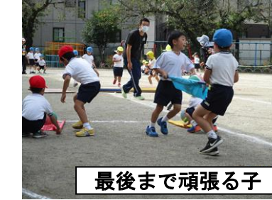
最後まで頑張る子