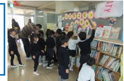
ひまわり文庫の貸し出し