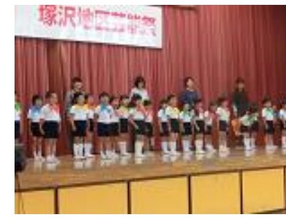
年長児の塚沢地区芸能祭参加