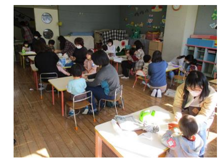
子育て支援（めばえ学級）

【 目標具現化のための特色ある園活動と行事 】 日々の戸外・室内の様々な遊びを通して活動の楽しさを味わわせ身体と心を育てる保育活動